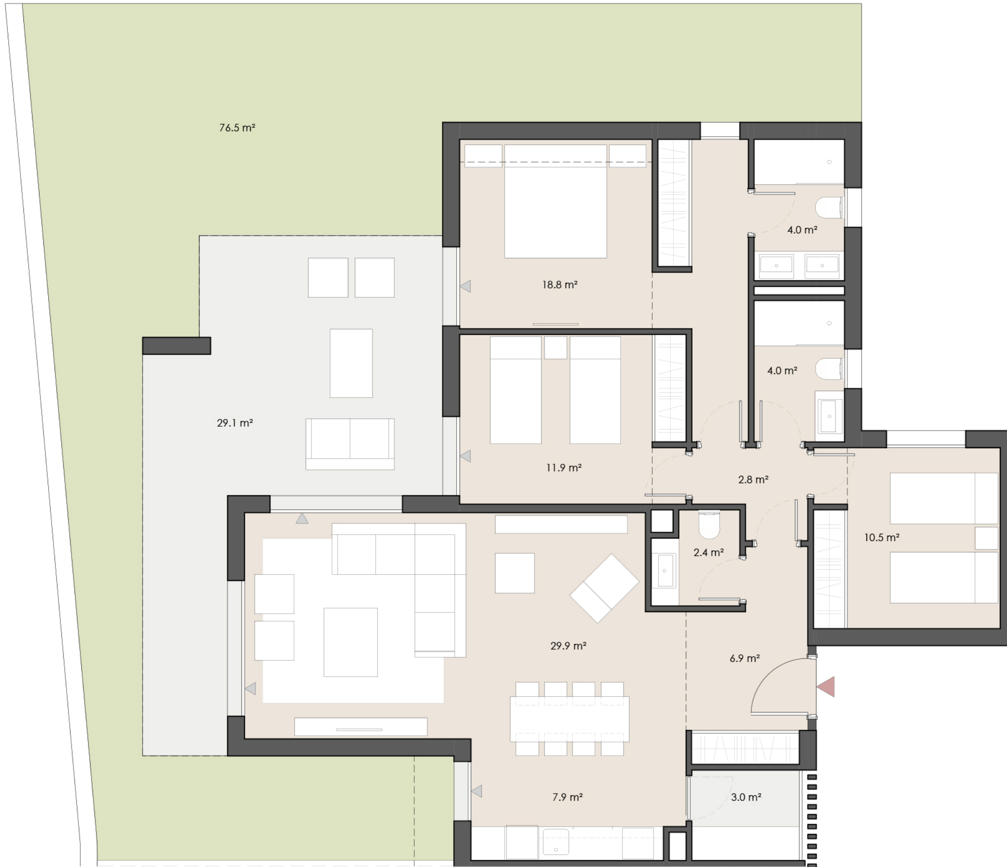
EDIFICIO / BUILDING 03